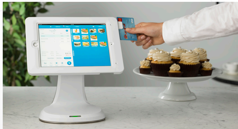
Transforme les tablettes en postes de travail entièrement fonctionnels