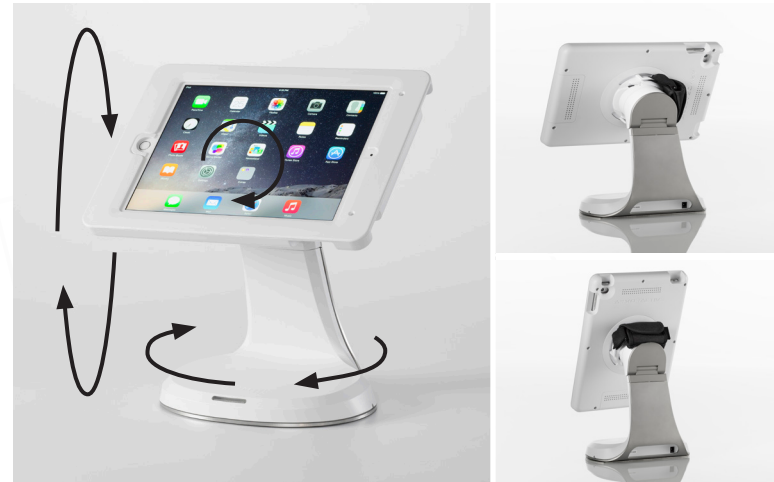
Plusieurs inclinaisons et rotations possibles