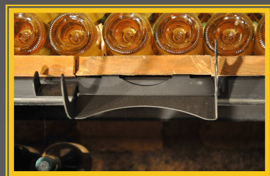
Porte-bouteille fixé sur bord d'étagère